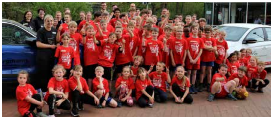
Über 70 Kinder waren im BSV-Ostercamp dabei. Der Dank gilt allen Trainern!