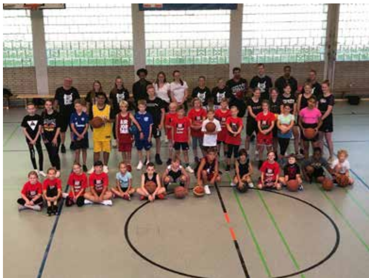
Volle Wittenbrinkhalle beim Sommercamp. Für Ostern ist das nächste geplant.