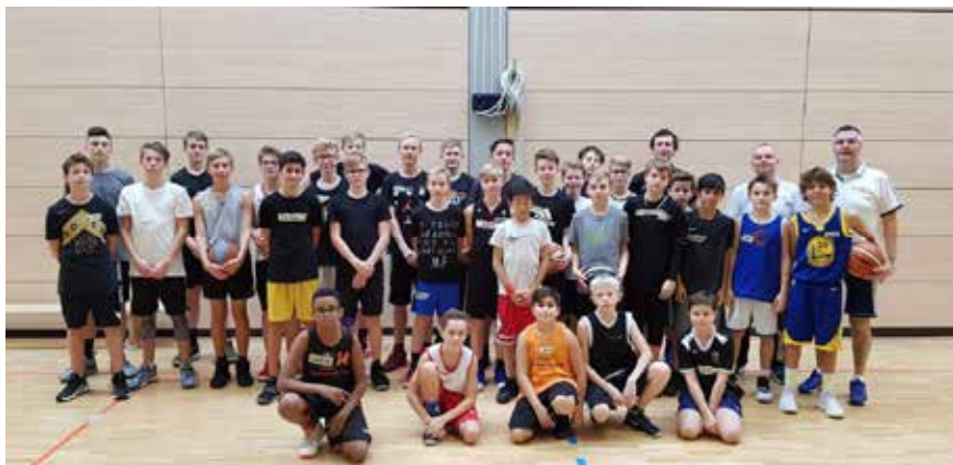
Auch BSV-Talente wurden zum Metropol-Perspektivkader eingeladen.