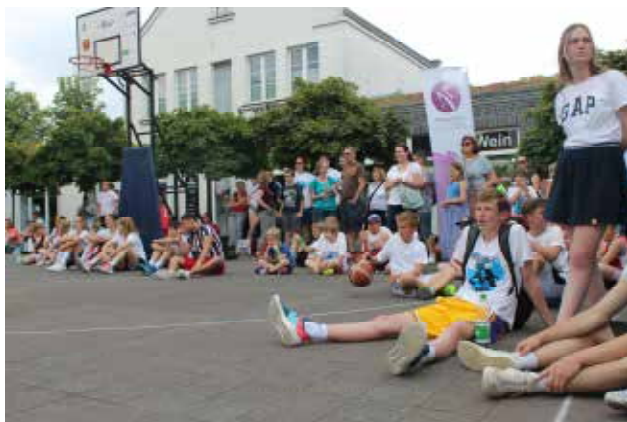
Der Brauturm-Platz war im Juni fest in Basketballer-Hand.